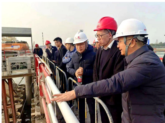
全生产重点工作,始终做到思想不松、标准不降、力度不减,全力维护安全生产形势持续稳定,确保在建工地平安和谐有序。(工程部 供稿)